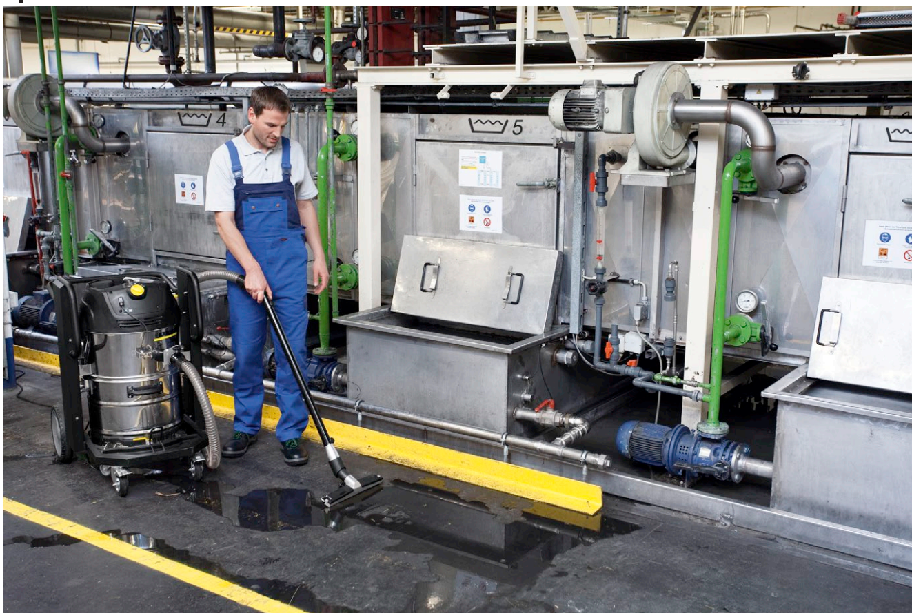
IVC 60/24-2 Tact² M